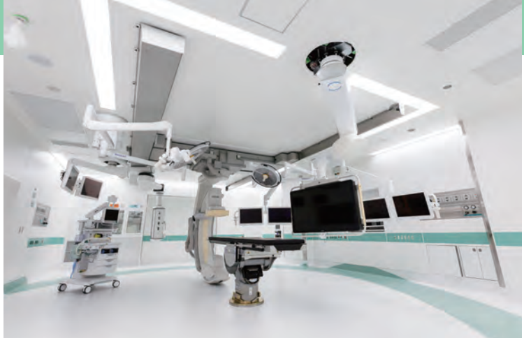
TAVI専用のハイブリッド手術室

を受け、ご自分の心臓をいたわっていただくことです。また、心臓弁膜症の多くは心臓超音波(心エコー)検査で見えますが、心エコー検査には慣れも必要ですし、機器の精度によつては発見が難しいこともあります。定期的に専門医による検査を受け、「今の心臓の状態」を詳しく知っておくことも必要です。そして半年に1回程度は、循環器の専門医がいる病院で心エコー検査を受けましょう。